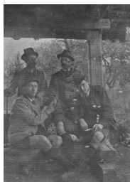
19f. der Wald in Graz 1902 (Zaner von rechts)

Nach 8-stündigem Marsche erreichte ich Cilli, die letzte an dieser Route gelegene deutschsprachige Stadt.“ (Grimm 1902, Reisetagebuch, S. 11f.)