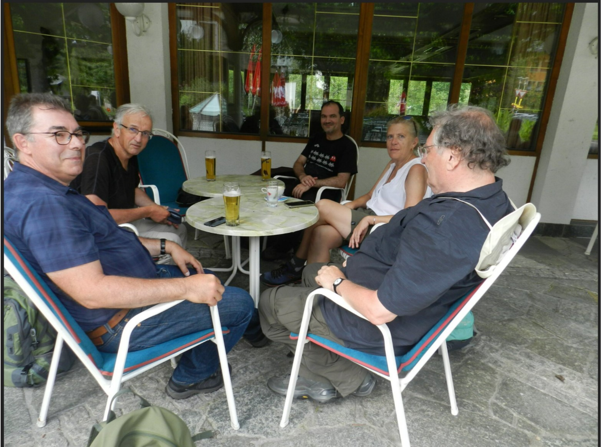
Erschöpft, aber glücklich genoss die sportliche Gruppe nach 28,6 Kilometern ein erfrischendes Getränk.